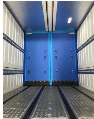
後部扉封印取付加工