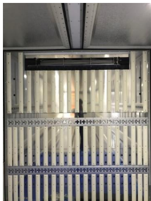
天面結露防止加工